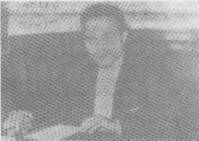
الجنرال محمد المذبوح

لقد كانت الجزائر ترى بقلق متزايد زيادة الاعانة العسكرية الأمريكية للمغرب وخصوصا بعدما اتهمها المغرب بخرق حدوده قرب «كولومب بشار» حيث أن عناصر من الجيش الجزائري قد أفلقت عناصر من الجيش المغربي. وبالفعل، فإن الحكومة المغربية طلبت شراء قطع سلاحية أمريكية وضع لائحتها الجنرال المغربي محمد المذبوح بصحبة كاتب الدولة في الدفاع الأمريكي،